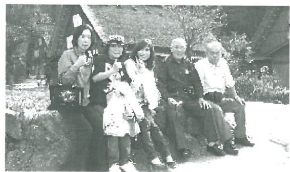
白川郷をバックにはいチーズ