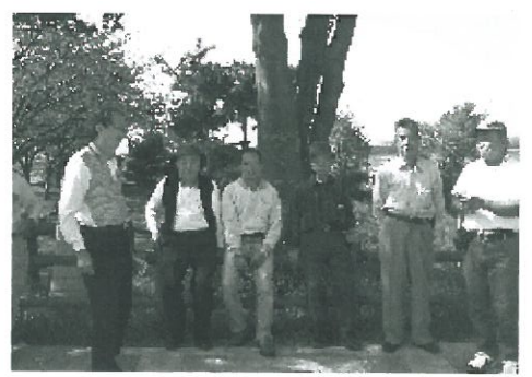
ひとやすみ、ひとやすみ

「安全対策について」、「労災保険について」と題し、建設業の事故で1番多い転墜落災害での事故事例を元に、実例的な安全対策を考えました。それと、ここ数年の猛暑で増加している熱中症対策として、救急処置や予防方法を学びました。