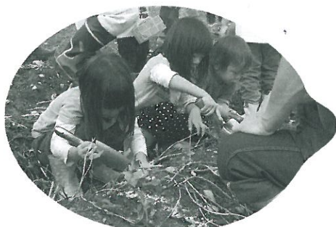
おいもどこかなー