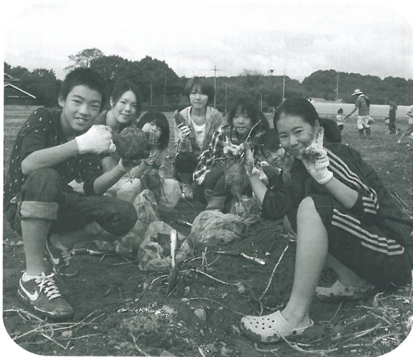
ゲンコツよりでかいもだぞー

農園のポニーやシカ 「もうこれでお開き やブタに触れ、泥んこ か」と思いましたが天