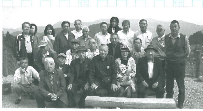
三方岩にて全員集合

10月16日、17日の2日間、労災一泊研修会を開催しました。32名の参加者があがり、紅葉の美しい白山、たがわ龍泉閣に宿り、紅葉の美しい白山、たがわ龍泉閣に宿り、スーパー林道や白川泊し英気を養いました。郷、郡上八幡などをめ