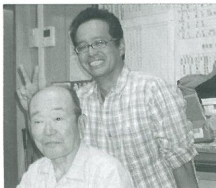
仲間を紹介したよ