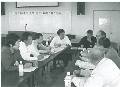
わきあいあいと賑やかに

いよいよ春の訪れです。春といえは3月から5月の3か月間の春の拡大月間が始まります。最近の組織数は皆さんもご存じのとおり減少傾向にあります。そこで垂水支部では、「数は力なり」をスローガンに今季の目標を26名として活動をしていきます。捨て看板立てもその一環で、垂水区でもかなりの数が立っています。大通りや裏道にも組合の存在を知ってもらえるように、また組合に入ってもらえるように立っています。皆さんもそれぞれの職場で新しく働く方や組合を知らない方に、組合に加入してもらえよう一人でも多くの方に声をかけていただき、目標が達成できるようにご協力お願いします。組織部 木村記