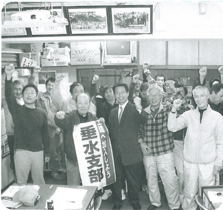
みんなで目標達成がんばるでー