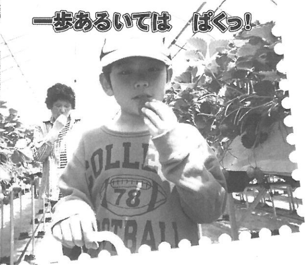
一歩あるいては ぱくっ!