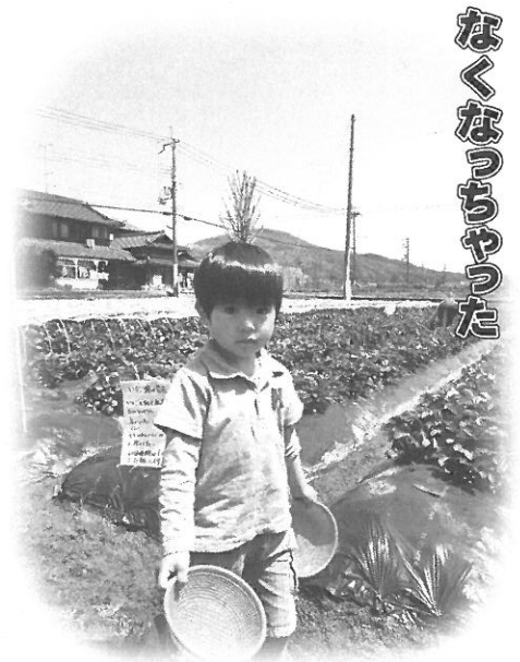
なくなっちゃった