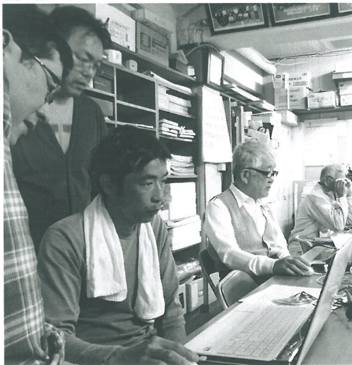
真剣な表情・・・だけど和気あいあい

「パソコンの基本」を中心、レベルに合わせて「エクセルの基本」と二本立てで行いました。いつもと違う試みでうまくいくか不安でしたが、「楽しかった。皆さんと一緒に仲良くできて上達しました」「デジタルカメラのデータの取り込み方をわかりやすく教えてもらった参加者の声を聞いた。