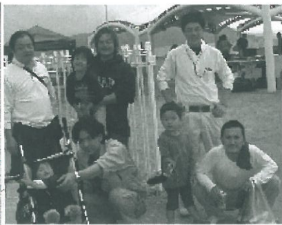
昨年のバーベキュー

労災保険加入もすすめて 拡大月間最後の訴え 春の組織拡大月間 も残りわずかになり ました。建設国保以 外でも労災保険への 加入もすすめてくだ さい。(仕事中のケ ガには建設国保は使 さい。 支部目標は22人。 5月13日現在の拡大 者数は13人です。厳 しい状況ですが、目 標達成にご協力くだ さい。