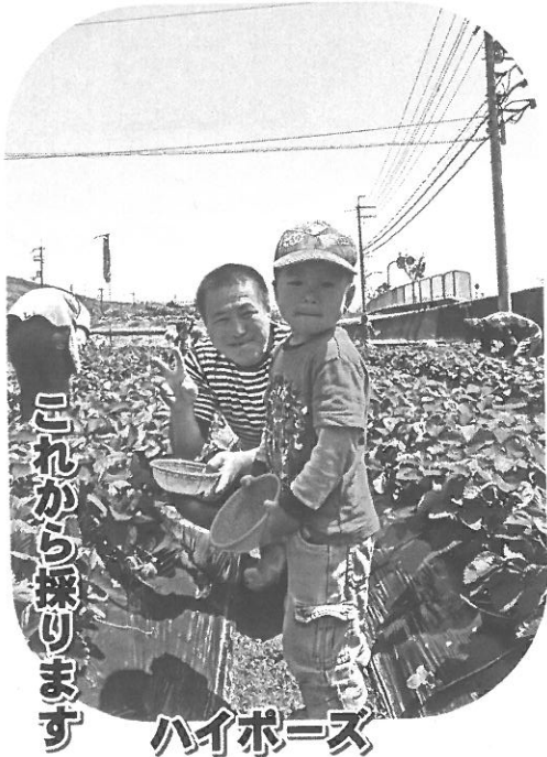
これから採ります