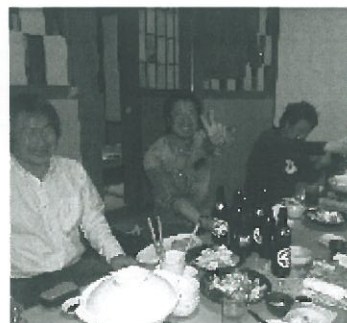
部会の後の飲み会

6月15日(土)19時よ り、支部会議室で「青年 部総決起集会」を開催 します。