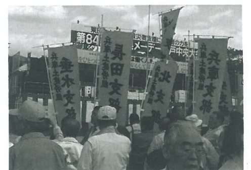
式典を見守る仲間たち

5月1日に第84回兵庫県メーデー神戸中央大会に始めて参加してきました。朝、9時15分に湊川公園に集まり大倉山公園までデモ行進、その後式典に移っていきました。