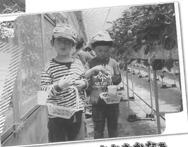
ちょっと つかれたかなあ