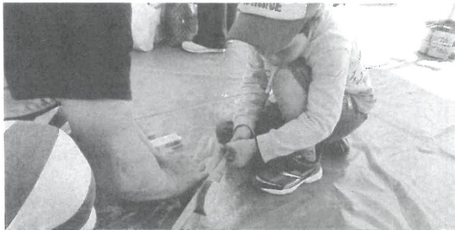
スノコを作る真剣な姿、最後までもう少し