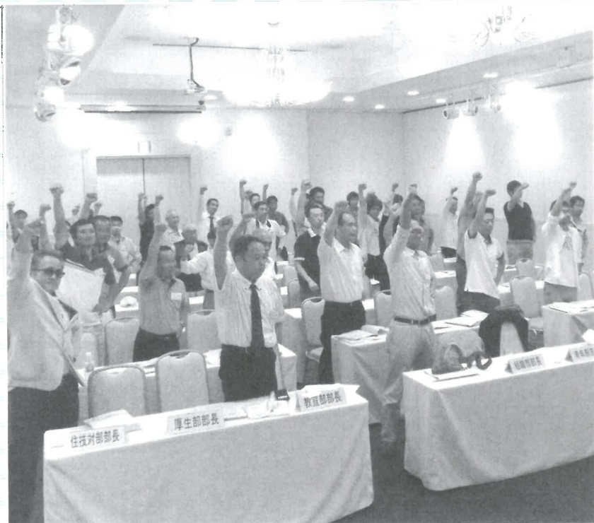
やっぱり最後は ガンバロー!!!