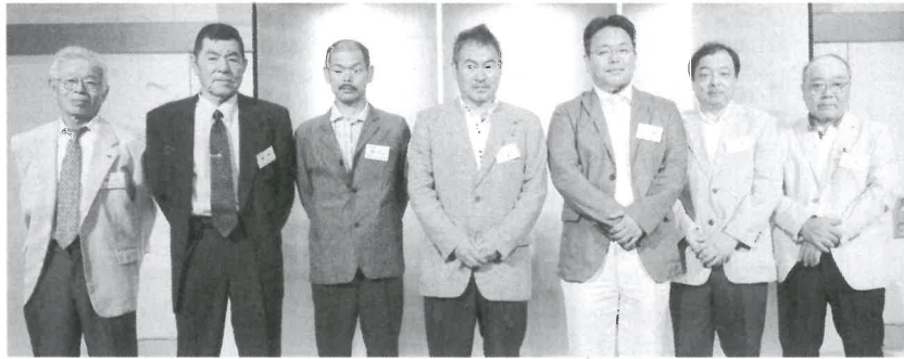
御協力お願いしま—す