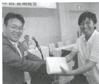
拡大達成 グッジョブ!