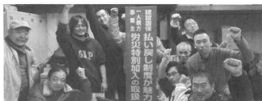
よっしゃーガンバロー

9月16日、組織部では垂水支部会議室にて、組織長期戦略会議を支部五役、各専門部長、各分会長、12名の出席者で、組織拡大のための会議などを行いました。