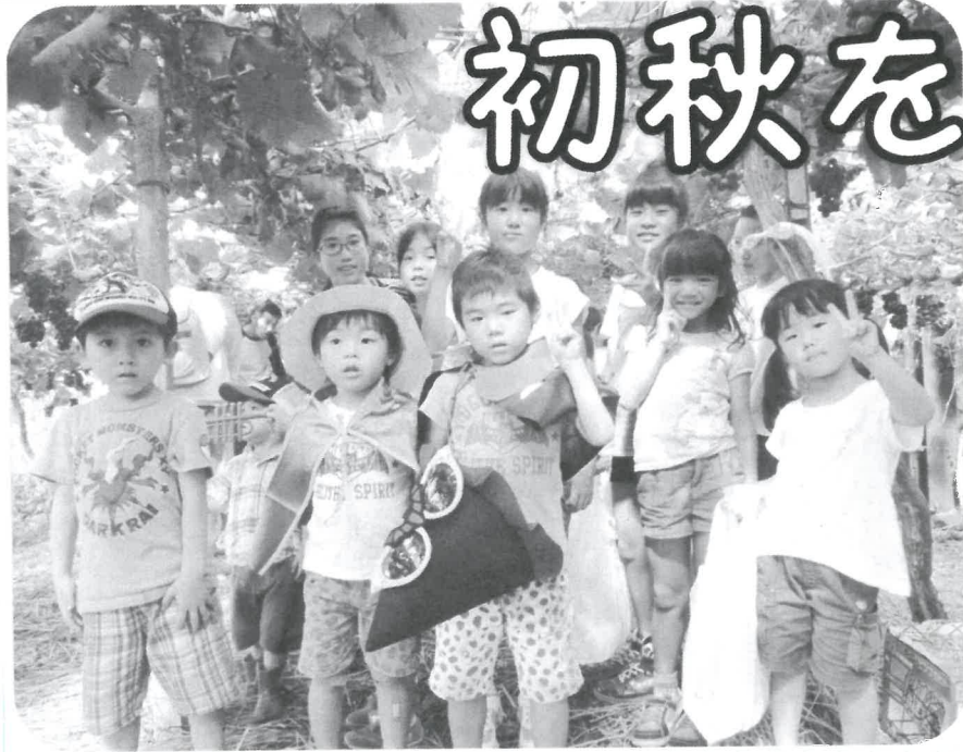
※ホームページにも写真をアップするから見てね