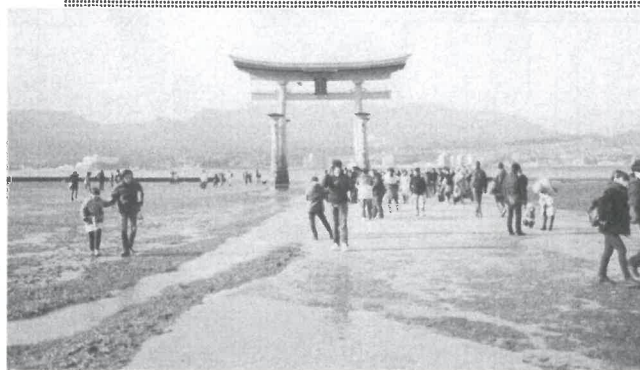
鳥居をくぐり初詣 いいことあるかな?

13時頃から大雪がふりだし、あつという間に鳥居や神社は真っ白に。厳島の白銀の世界が目の前に現れて、神