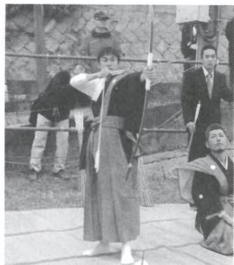
3年前の晴れ姿です

私の住む東名谷の集落では毎年弓引き神事を行います。弓を引き射て、悪霊を払うといわれています。無病息災と豊作を願って古くから行