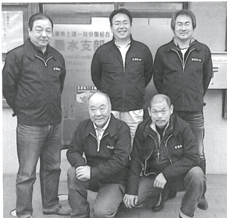
新年おめでとうございます

新年明けましておめでとうございます。 大震災から20年目の節目であるこの年に「ガンバロー!組合活動」を支部運営方針として、組合員の皆さんが参加しやすい組合にしたいと思えます。そして、活発に組合活動に