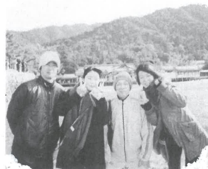
なかよし家族だよ

1月2日に、私たちに、私たち夫婦と子供家族3人で世界遺産の厳島神社に行ってきました。その日は潮が引いて、三度目の正直でやっと鳥居の下へ歩いていくことができて良かったです。本堂の方へ行き、皆で今年一年の家の安全などの願い事を祈りました。