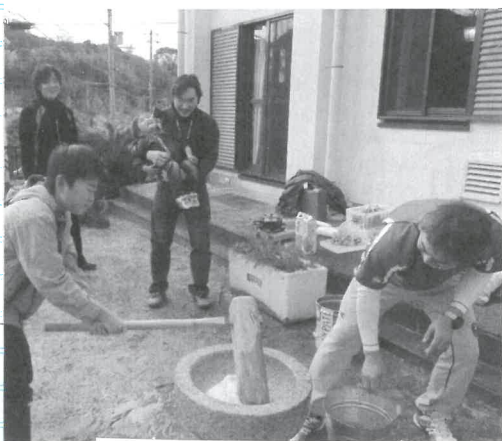
昨年のもちつきの様子