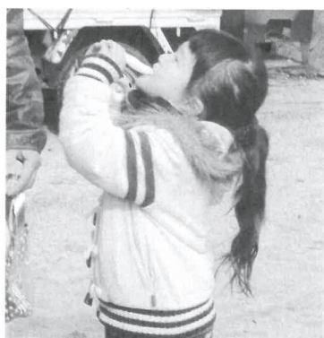
こんなにのびるよー

丸めて 丸めて 何つける? ... 餅に飽きたところに、青年部の奥さんに餅ピザや豚汁を作ってもらったのでとてもおいしかったです。天候にも恵まれ楽しい餅つき大会となりました。