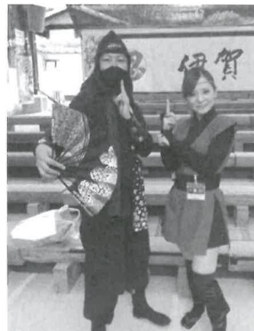
春が来たでござるよ