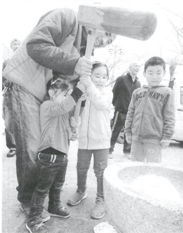
ねらいを定めて・・・うつべし!!