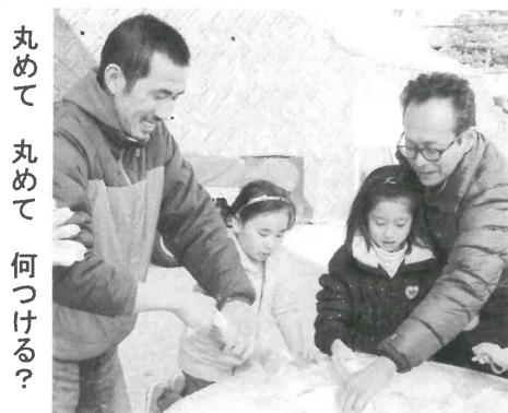
丸めて 丸めて 何つける?