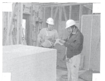
作業しやすそうな現場

今回も、谷六建設株式会社さんの協力で、次回チャンスがあれば、中級あたりを学習したいです。講師、スタッフの方々夜遅くまで本当にありがとうございました。