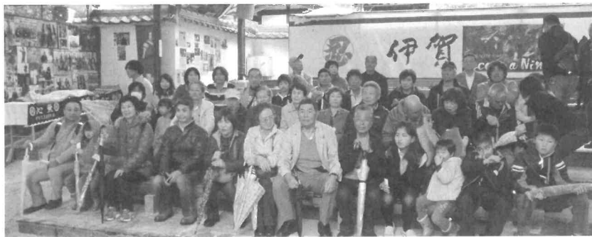
伊賀の里でにんにんにん

3月29日に伊賀の里 モクモクファームと忍 者屋敷に59人の参加で 行ってきました。ファ