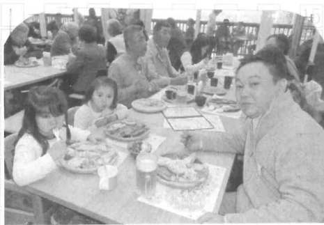
モクモクファームでもぐもぐ