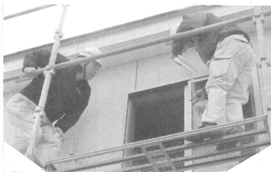
しっかりした足場やー

3月5日(木)午後 神戸市西区桜ヶ丘の木造2階建ての新築現場にて安全パトロールに行ってきました。