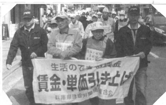
大丸前を整然とデモ行進

組合員36人、家族10人、 合計46人でした。(全 体参加者は821人) 午後1時20分からア スベスト救済や公契約 条例制定等、シユプレ ヒコールを上げながら 県庁前まで約1時間デ モ行進を行いました。 (山添正幸)