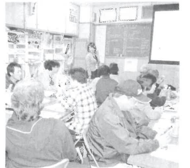
みなさん真剣です

3月23日(月)19時より垂水支部会議室にて、住技対部主催のスマートフォン教室を開催しました。参加者は18人で、「ソフトバンク名谷インター店」から講師6人に来ていただきました。初心者向けに映像で初め、実際にスマートフォンを使った操作方を学びました。