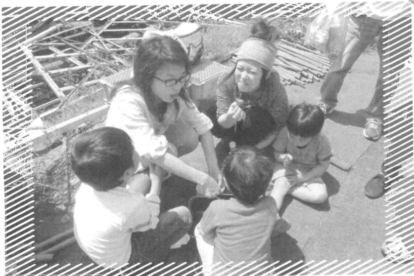
ええか! いっぱい取って来いよ!!