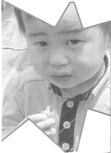
オレのカット最高?