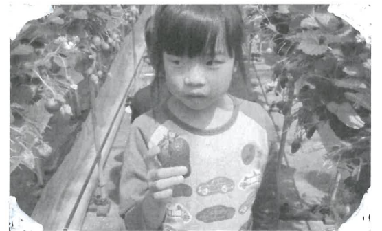
デリシャスな味だね