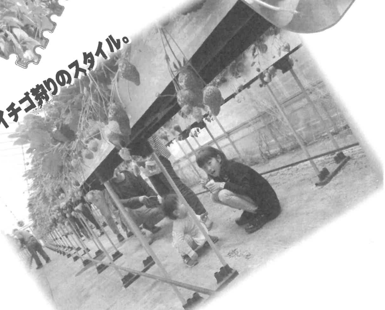
新しいイチゴ狩りのスタイル。