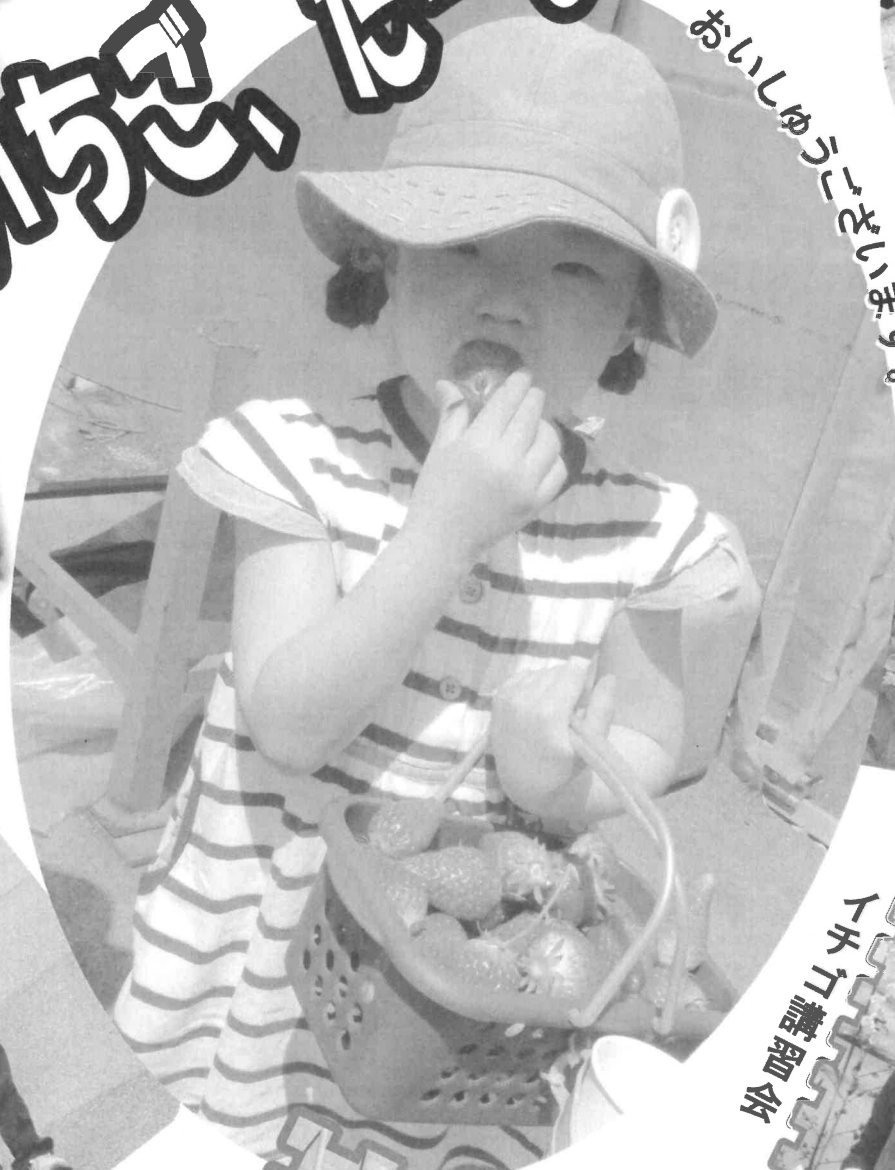
おいしゅうございます。