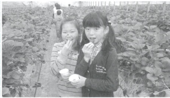
ストロベリーな味だね

近い昔の5月3日、ある家族が本部青年部レクリエーションに参加したそう。大人も子供も夢中になる潮干狩りと、お昼はBBQを堪能し、楽しいGWの1日を過ごしましたと。青年部 竹村 英護 記