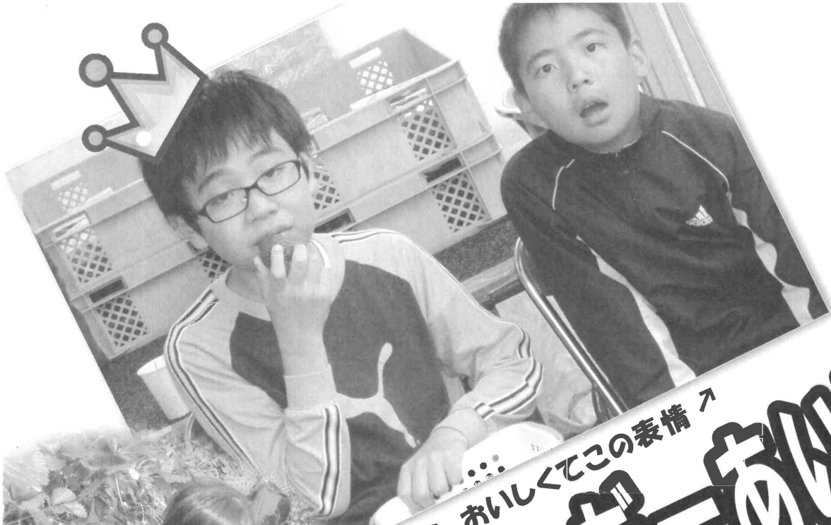
↑ おいしくてこの表情 ↑