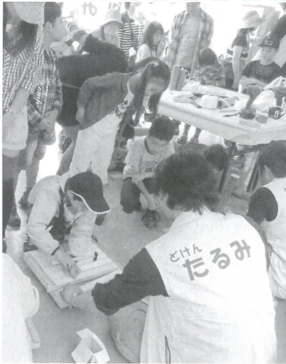
けがしないでよー

今年、竹の下駄と杓が人気で私たちが後半はてんでこ舞いでしたが、子どもたちからおじさんありがとうの