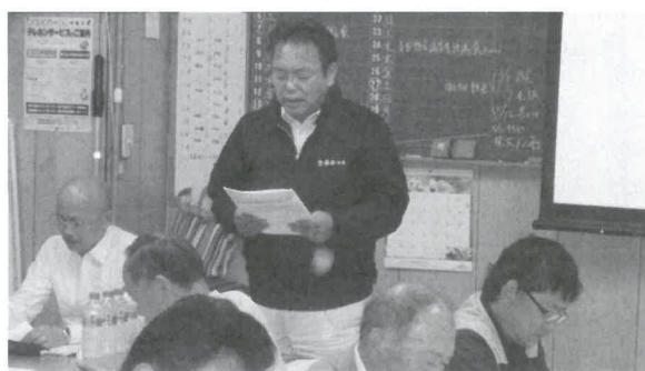
みんな真剣に学習しています

最近の事故例として、労働者も加齢に伴い心身機能も低下し、労働災害が、起こっています。一番多い事故は、つまづき・墜転落などで、現場内では、整理整頓し足元に気を付け健康管理に注意しましょう。またこれからは、暑くなりますので、熱中症対策も怠らず、水分補給は、こまめに