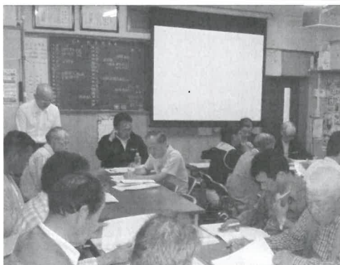
大勢の出席で暑いけど

6月7日に労働保険事務組合第48回総会が支部会議室で開催された。24名の出席でした。