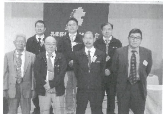
継続は力なり3期目の支部五役

26年度の経過・決算・会計監査報告後、27年度の運動方針・予算案が審議され採決。組織拡大達成分会が表彰され授与されました。