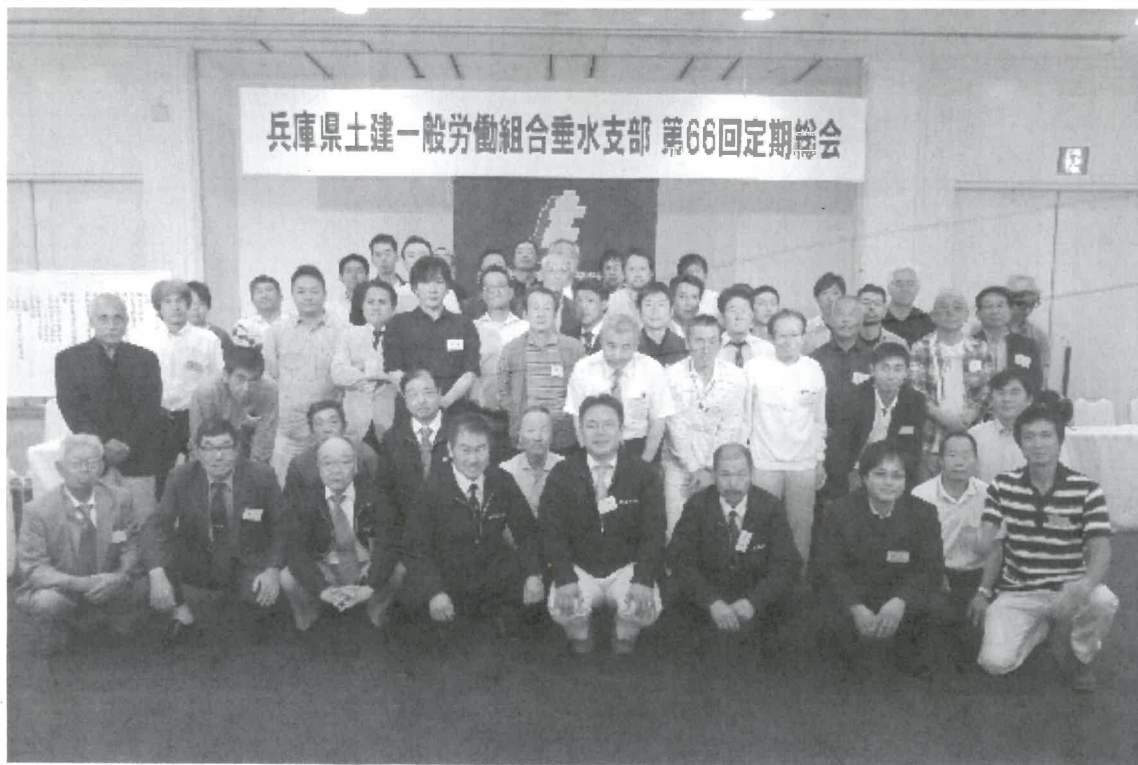
兵庫県土建一般労働組合垂水支部 第66回定期総会