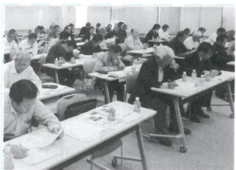
教宣好きが集まった?

10月25日、学校厚生会館にて本部教宣実務学習会を28支部65人(垂水から2人)参加で開催しました。今年のテーマは「伝わる記事の書き方、見出しのつけ方」です。講師の方の話も上手