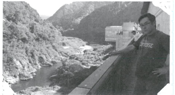
絶景かな!!...大歩危峽