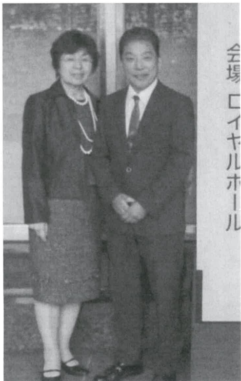
表彰会場にて、奥さまとともに