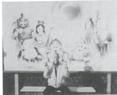
私も入れて8福神で一す

も飛んでいて皆さん大笑い。 ラスト智禅寺、道内に入り本尊礼拝と住職の礼願法話を聞き、心が安らぎました。 「七福神祭りは」淡路島の新しい祭りごととして定着しているそうです。お参りを堪能したので帰りは、久しぶりに、母ちゃんと淡路島のサービスエリアで夜景を見ながら食事しました。