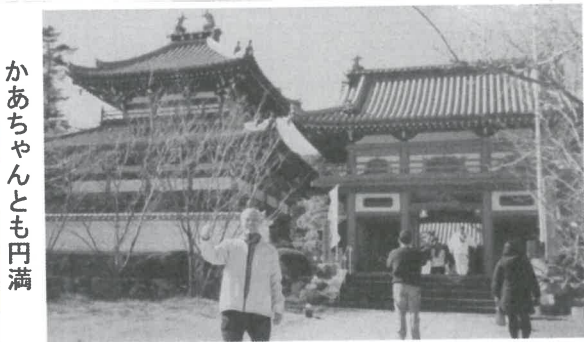
かあちゃんとも円満

宝生寺は、長寿の神ということで入念にお祈りして長寿の橋も渡りました。観光客の中には、反対から渡る人もいて仲間から寿命が短くなるよとやじ声ぶりに、母ちゃんと淡路島の新しい祭りごととして定着しているそうです。お参りを堪能したので帰りは、久しぶりに、母ちゃんと淡路島のサービスエリアで夜景を見ながら食事しました。 谷脇 英生 記