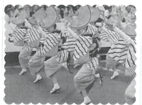
であ、かんがで踊りなはう

まだまだ寒い日もありますが、春はすぐそこです。垂水支部、春のレクリエーションのご案内です。 今年、淡路島から鳴門をめぐります。 まずは淡路島へわたり、福良港から鳴門観潮船・日本丸に乗って、世界最大のうずしおをご覧いただきます。次に津波防災ステーションにて、津波の恐ろしさを、災害からの逃れ方を学びます。 お楽しみのお昼ご飯は、みさき荘で豪華淡路牛を堪能。 鳴門海峡大橋をわたり、一路徳島へ。阿波おどり会館にて阿波踊りを体験します。 さあ、申し込みは垂水支部まで。 (705-2048)