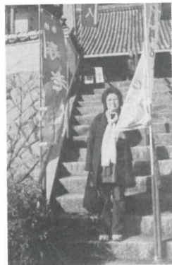
うちのかあちゃんです

家庭円満と和合を授かる寺、護国寺から順に拝観していきましました。 福良のほうからまずり家庭円満と和合を授かる寺、護国寺から順に拝観していきましました。