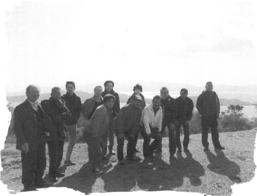
ほんまええ天気で気持ちええなー

初日は牛窓オリーブ園に行き、豪華フレンチをいただきました。絶景の中でのランチはともおいしく、周りに少し迷惑かな?と思いつつもにぎやかに楽しくすごしました。