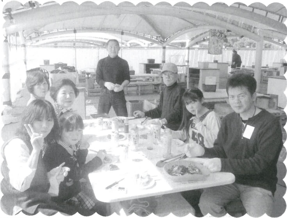
ピースサインで準備オッケー