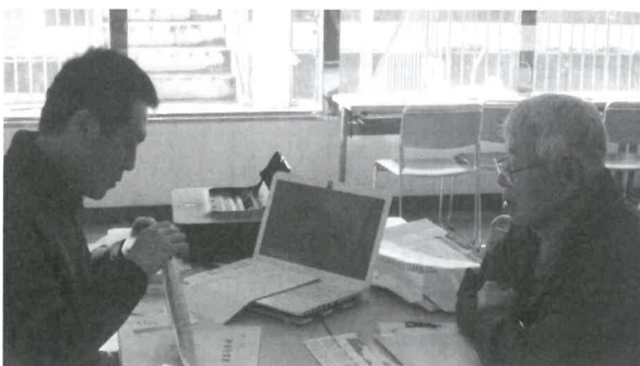
はいお疲れ様でした