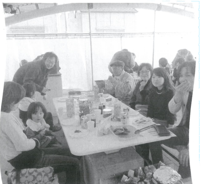
あつ熱のカキ、イカ、ソーセージ

と親睦を深めて、楽し い大人の多い中、子供 と親睦を深めて、楽し い大人の多い中、子供 くカキを堪能しまし た。 たちが海岸で元気よく 遊ぶ姿が微笑ましかつ た。