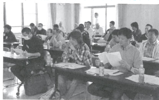
一昨年の活動者会議の様子