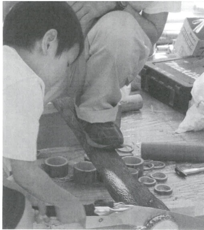
のこぎり、しんどいな～