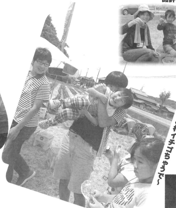
おっ金葉さんにはやうらん