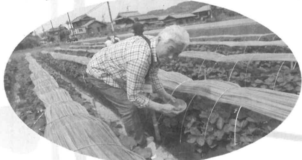
うまそうなのに、低すぎるー