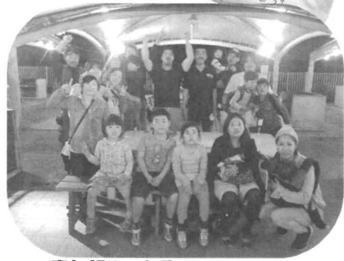
青年部やったるでー