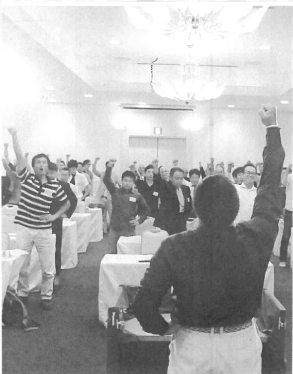
今年度もやるぞー！おー！

3月25日から5月25日までの「春の組織拡大月間」において、22人の拡大となりました。支部目標には届きませんでした。垂水東分会と舞子分会は、あと1人で目標達成でした。 3月25日から5月25日までの「春の組織拡大月間」において、22人の拡大となりました。支部目標には届きませんでした。垂水東分会と舞子分会は、あと1人で目標達成でした。 本部定期総会にて表一言。役員、幹事は皆さんに「ご協力ありがとうございました」 本年度もやるぞー！おー！