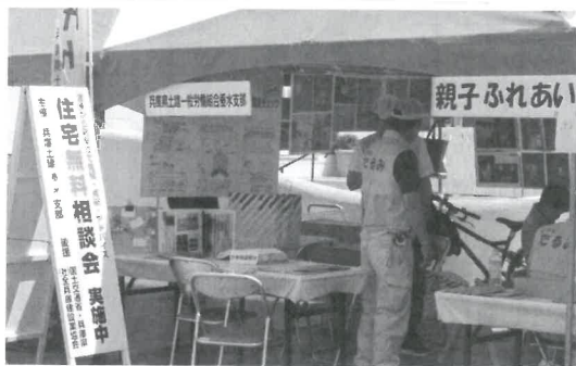
準備OK いらっしやいませ～