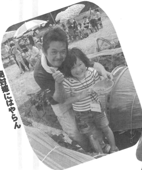
おっ金葉さんにはやうらん