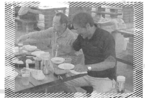
焼いては食べ、 そしてまた焼いて食う