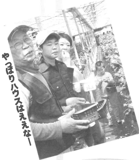
やっほりハウスはええな