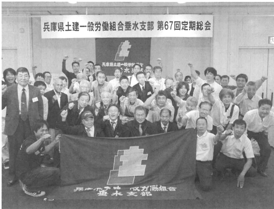
今年もガンパロー