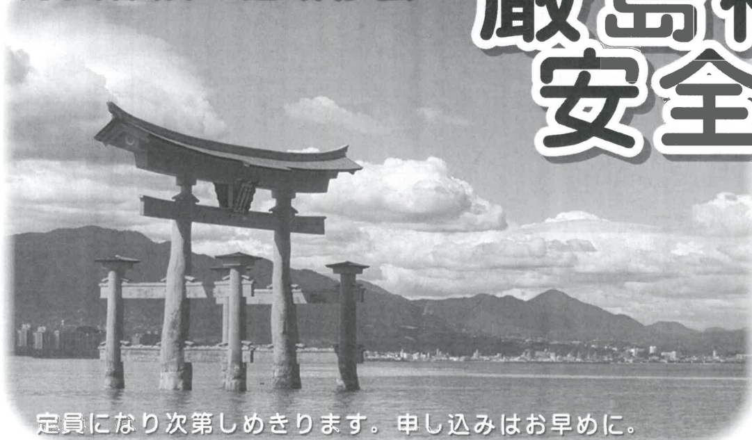
定員になり次第しめきります。申し込みはお早めに。

残暑の続く中、お仕事お疲れ様です。労災一泊研修会のご案内です。 労災保険の重要性などを学習します。今年尾道から安芸の宮島めぐり、大和ミュージアムを見学す