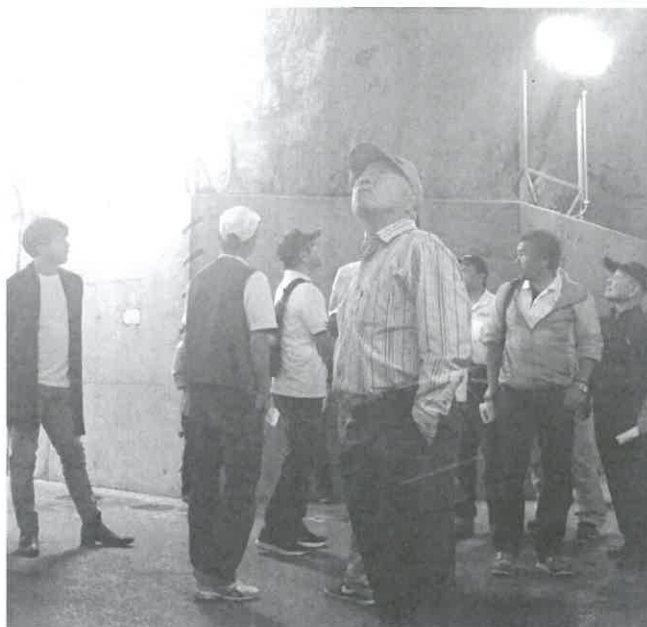
でっかい施設に興味しんしん