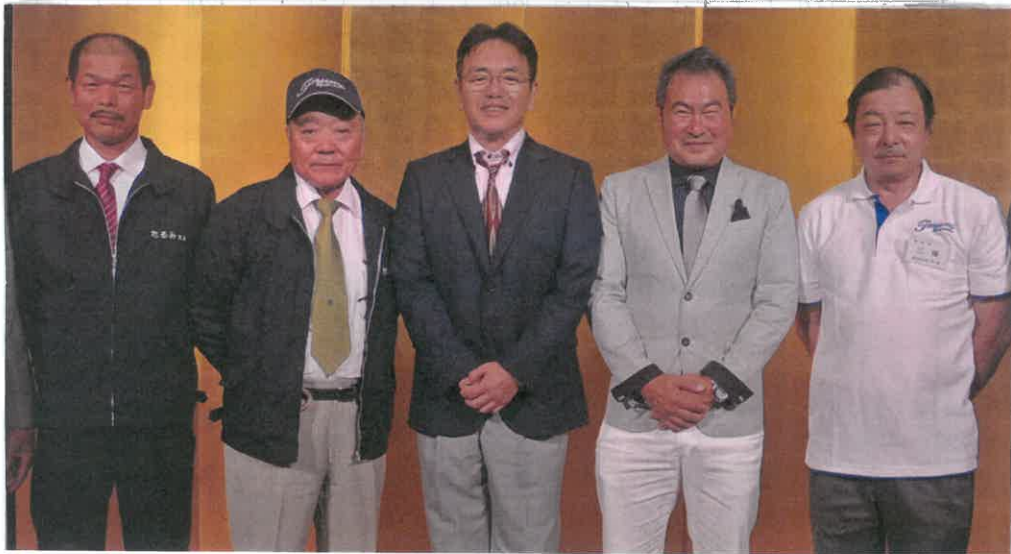
新年を笑顔でむかえた支部五役 (写真は総会時)