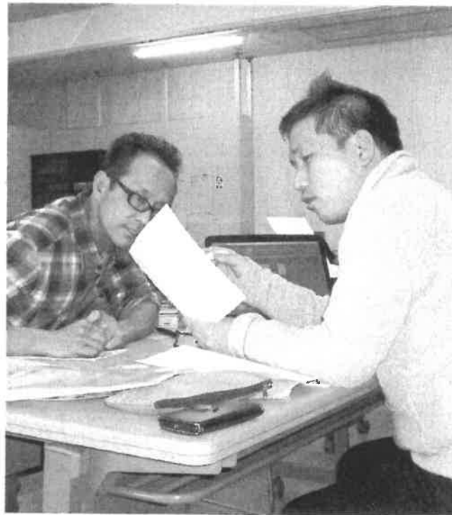
もっとやすくなりますー?

2月8日(水)から16日(木)までの間で確定申告相談を行いました。今年からマイナンバー制度の関係で、申告書の各自で税務署に出すことになりましたが、特にトラブルなくスムーズに進行しました。ひとつ気になったのが、あまり帳簿をつけていないまま来られて、とても長い時間がかかった方がおられたので、できればある程度帳簿は完成させて来ていただくようお願いいたします。決算講習会にも参加して自分で帳簿をつけられるようになりましょう。