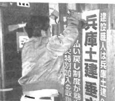
部長自ら心をこめて