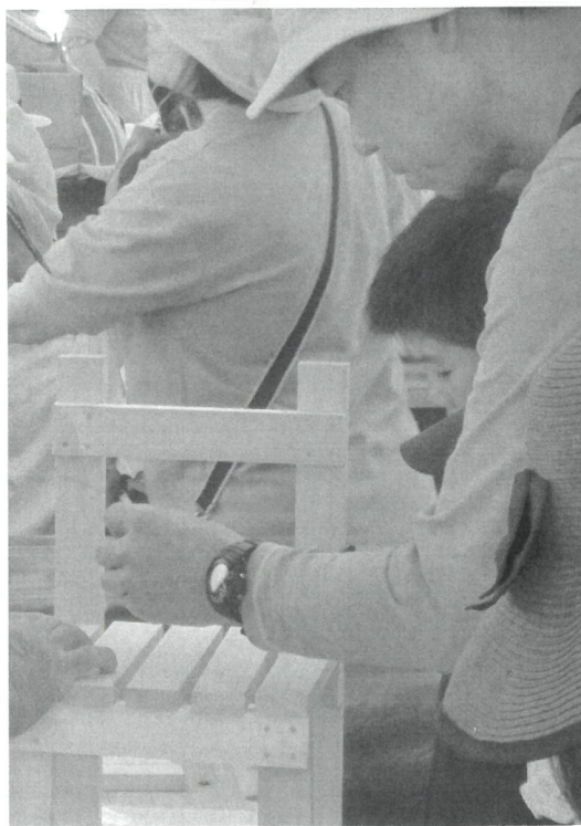
椅子作りに集中、集中。