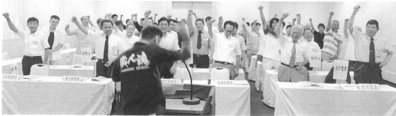
この勢いでいくでー