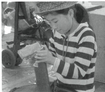
仕上げは丁寧に(竹細工)