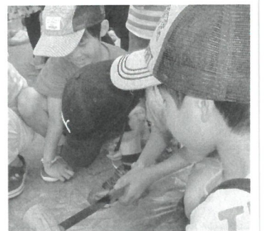
腰をすえて丸太切り

時に受付を開始し順次組立しました。時間が予測できず不安でしたが、(1組約40分で組立)時間内に無事終了でき、他にも竹細工、丸太切りもしました。