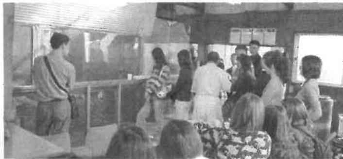
巧みの技見れたらいいのね