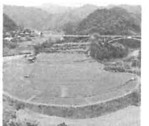
美しい棚田の風景