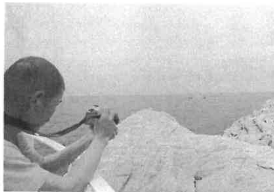
きれいに撮れたかな?