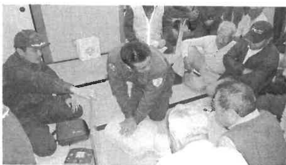
真剣に講習中(去年の様子)

人は忘れるものです。何回も学習して本当に必要になったときに役に立てるようにしておきましょう。