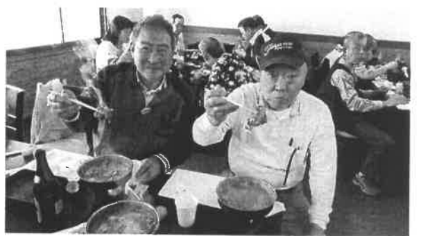
三大牛しばいたったどお～