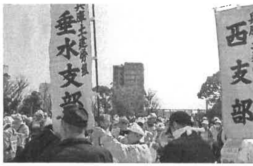
さあ、デモ行進いこうか

応募方法、注意事項は今月の機関紙本部版に載っているので、そちらを参照してください。