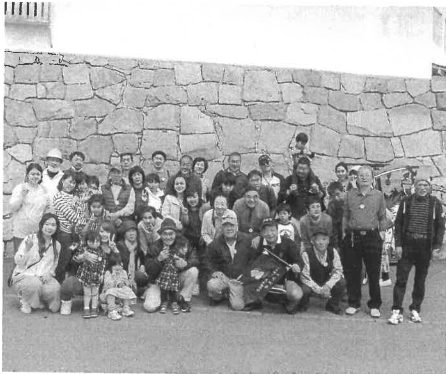
三大牛との決戦を前に関ヶ原にて