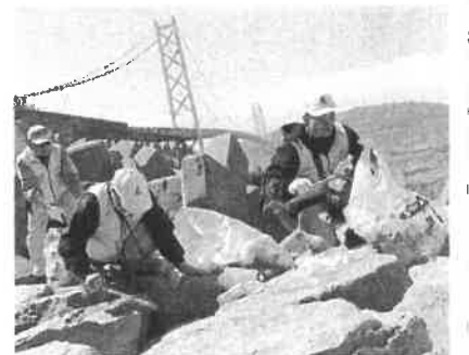
こんなところにゴミが・・・

4月8日(日)9時より大人11人、子供1人で西舞子海岸からアジュール舞子にかけて海岸清掃を行いました。