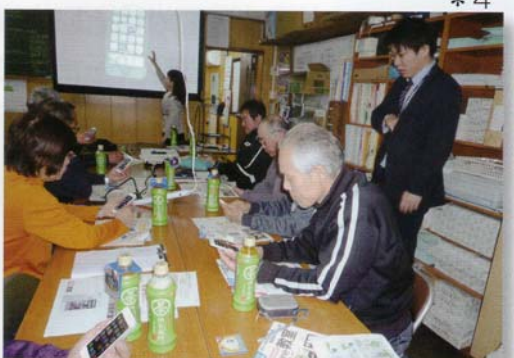
スマートフォン、むずかしい～