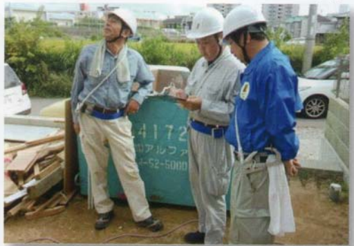
安全パトロール・整理整頓しっかり出来てます

8月26日 兵庫県健康財団西事務所にて健康診断実施 9月2日 両日で 316人受診