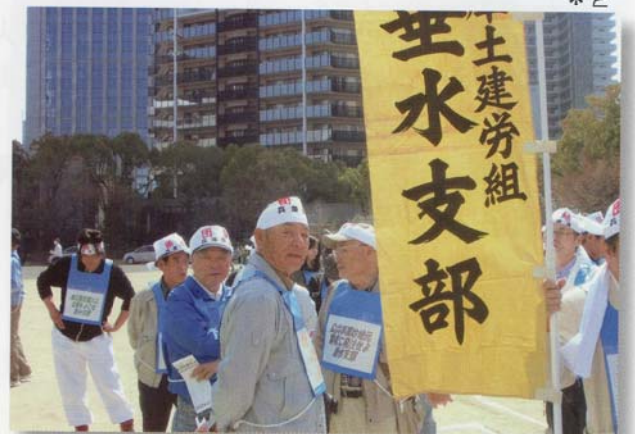
さあ！デモ行進に出発