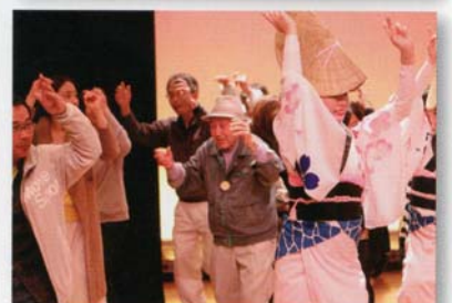
皆で楽しく阿波踊り