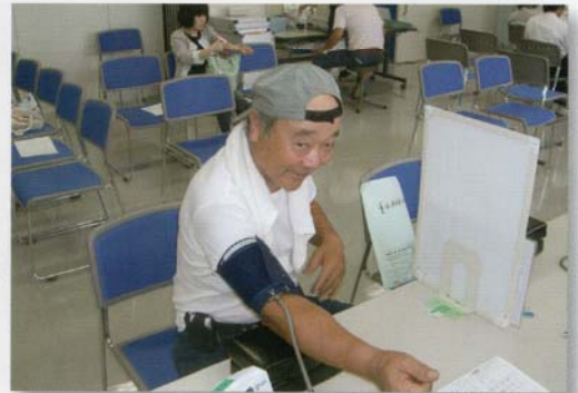
*1 血圧! 高くありませんよ～に!!