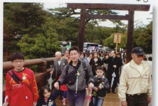
雨も止んだ！お土産を買いに行くぞ