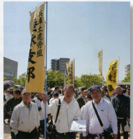
メーデーに参加！デモ行進に出発