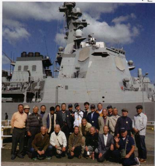
護衛艦の前で記念撮影