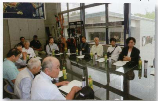
工場見学後、社長と懇談会