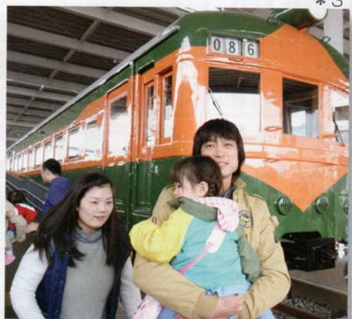
鉄道博物館はちょっと疲れた?