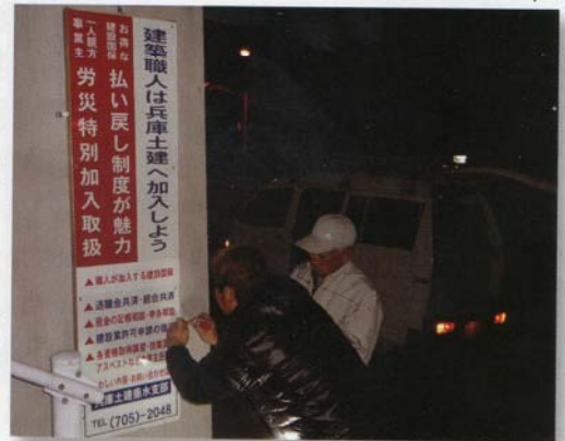
拡大達成目指して看板立て実施