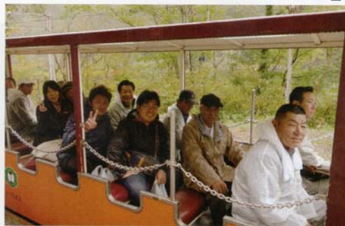
トロッコに乗って出発進行