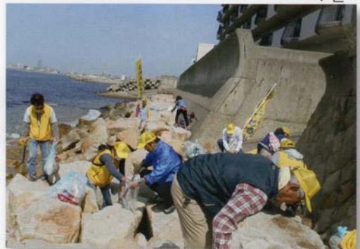
皆で海岸をきれいにしましょう