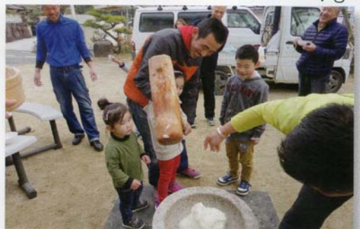
お餅つき、重たいけど頑張る