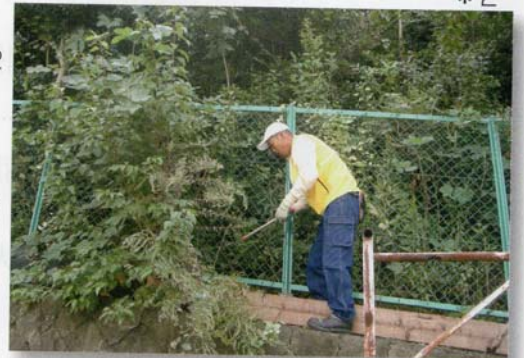
*2 奉仕活動・里山整備