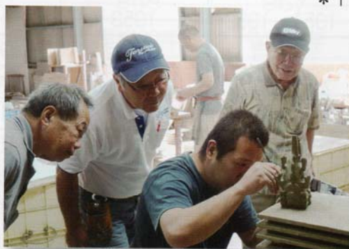
瓦工場で職人の技を見学