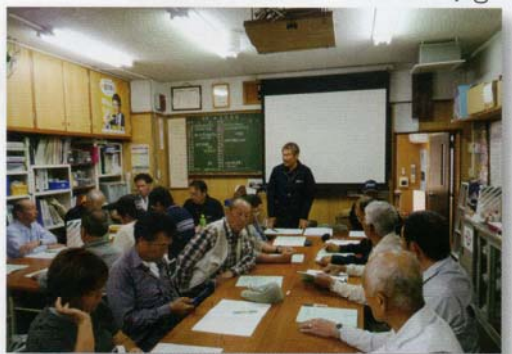
第50回労災記念総会