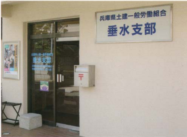
兵庫県土建一般労働組合 垂水支部 国民健康保険組合 労働保険事務組合