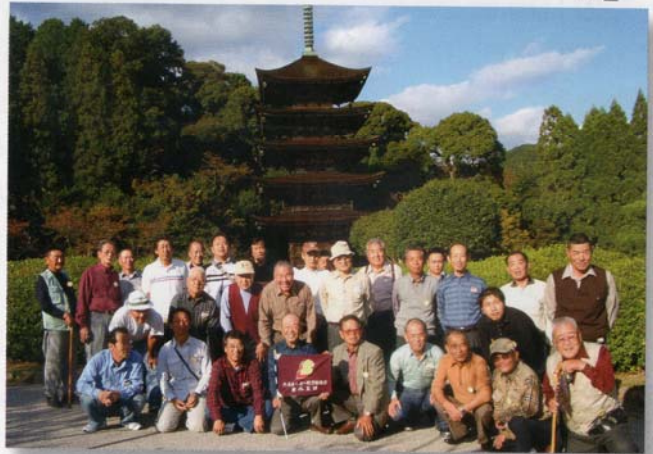
萩・香山公園の瑠璃光寺五重塔前で記念撮影