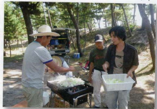
*1 夕飯は焼きそばかな