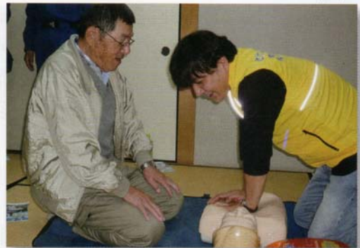
心肺蘇生術を実践中