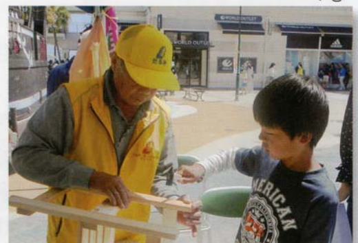
木工教室でミニチュアいす作成