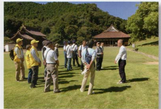
閑谷学校の庭で説明を受けてます