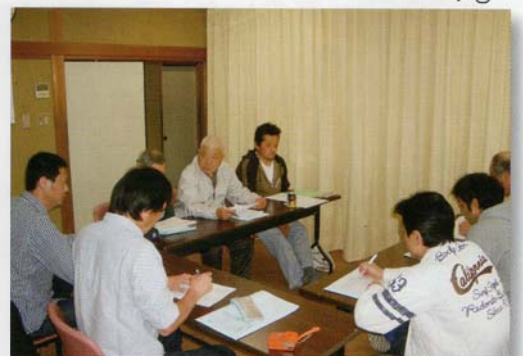
*3 活動者会議の分科会で熱心に討議中です