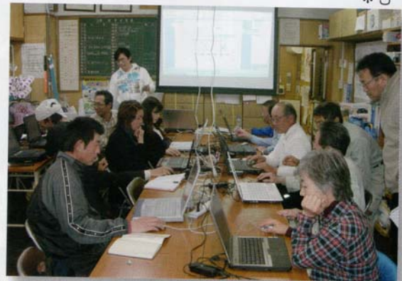
*3 パソコン教室大盛況