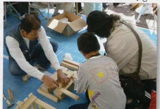
木工教室でイス作りに熱中