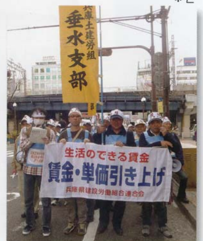
先頭に立ってデモ行進